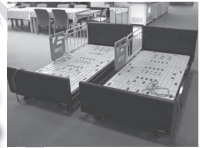
福祉用具貸付事業