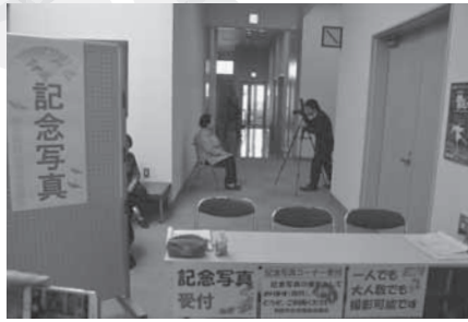
敬老会記念写真贈呈事業