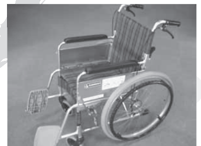
福祉用具貸付事業