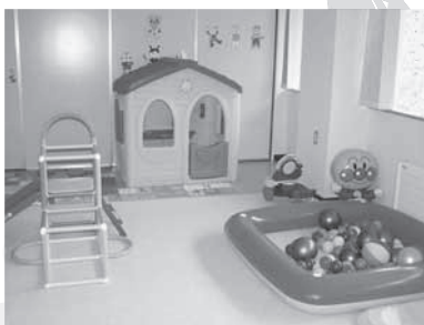
子育てサロン運営事業