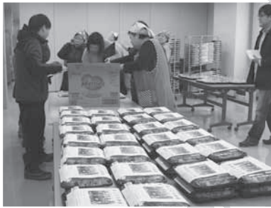
まごころ弁当事業