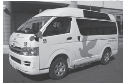
移送サービス事業