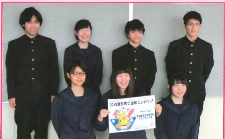
演別高校ボランティア部の皆さんがデザインした「ご当地ピンバッジ」は、とても好評でした。

【令和元年度 募金実績】 ◇赤い羽根共同募金 2,426,561円 ◇歳末たすけあい募金 714,828円 ◇災害被災地義援金 394,282円