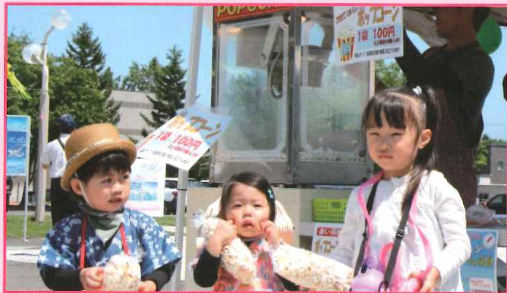
屯田七夕まつりでは、共同募金ブースを設置し、ポップコーン募金などPR活動を展開しました。

【令和元年度 募金実績】 ◇赤い羽根共同募金 2,426,561円 ◇歳末たすけあい募金 714,828円 ◇災害被災地義援金 394,282円