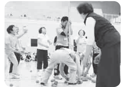
福祉スポーツ大会