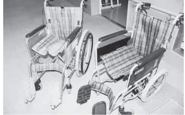
車椅子（左：自走式 右：介助式） 皆さまからお寄せいただいたリングプルと交換したものが数台あります。