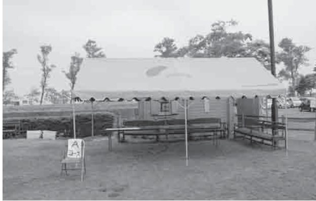
行事用テント（横幕・前幕もあります）