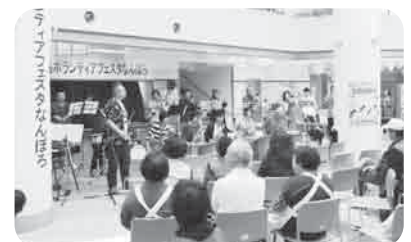
ボランティアフェスタ