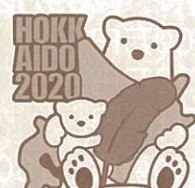
全道版 シロクマ親子