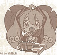
全国版 初音ミクバッジ