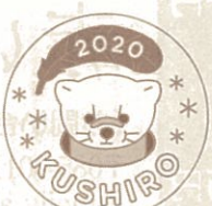
エゾクロテンバッジ