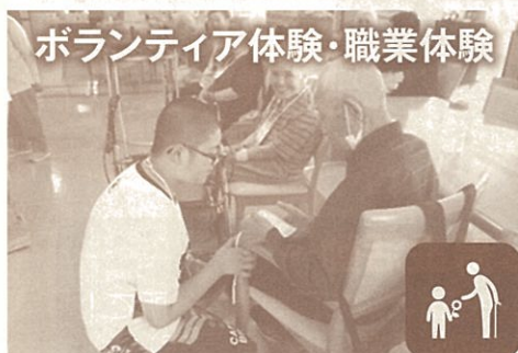
ボランティア体験・職業体験