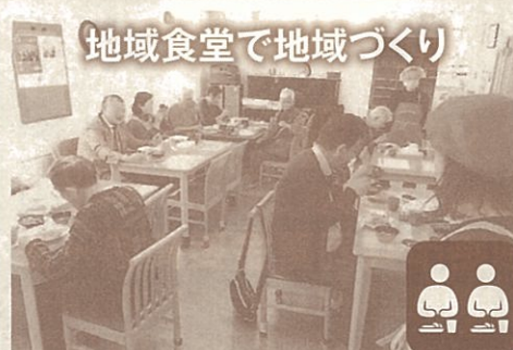
地域食堂で地域づくり