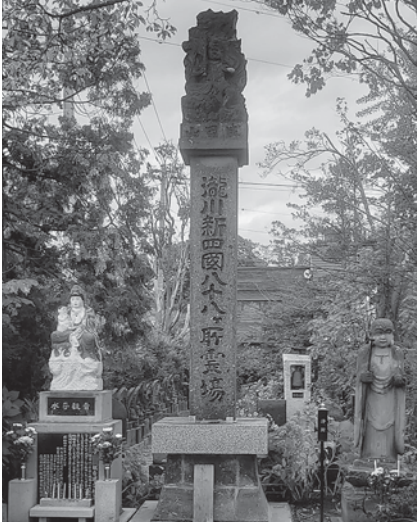
水子観音様の像(左)