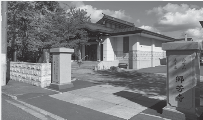
令和2年10月8日(木)水子観音様の像は大町5-2-6郷芳寺様境内北海道八十八箇所霊場第十二番札所に受け入れられました。

長年、水子観音様の管理を行っている「水子観音管理協賛会」は、観音様が祭られている滝の川斎苑のお堂の老朽化が進んでいることや、会員の高齢化など維持管理に苦慮していたところ、近年、法要の際にお世話になってい