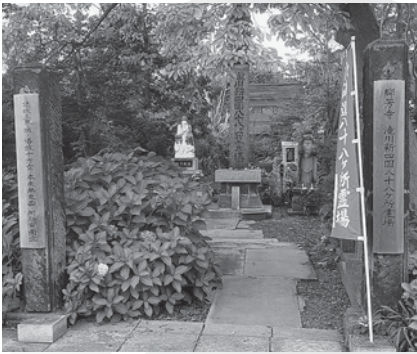
北海道八十八箇所霊場第十二番札所の入口