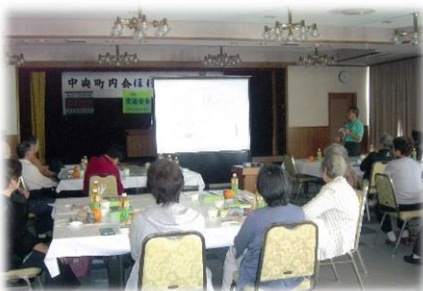
市内18の単位町内会 「ひとりぐらし高齢者支援事業」