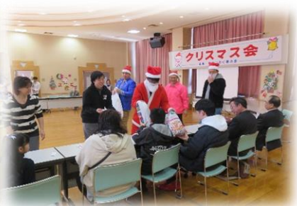
芦別市手をつなぐ育成会 「クリスマス集会」