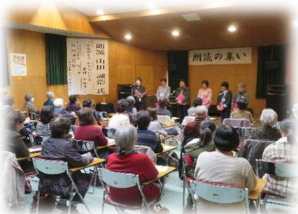
声のボランティアかりんとう 「朗読の集い」