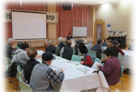
芦別市身体障害者福祉協会 「一日研修大会」