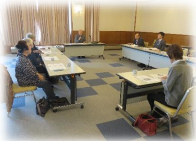
芦別市遺族会 「研修会及び新年交礼会」