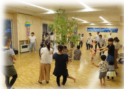
子育てサロン 「夕涼み会」