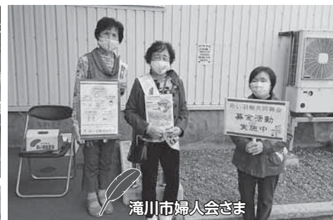
滝川市婦人会さま