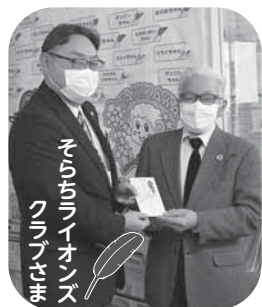
そらまはライオンズ クラブさま