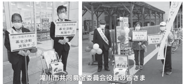
滝川市共同募金委員会役員の方々の皆さま