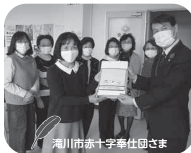
滝川市赤十字奉仕団さま