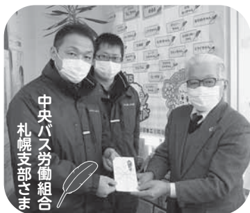
中央バス労働組合 札幌支部さま