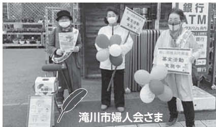
滝川市婦人会さま