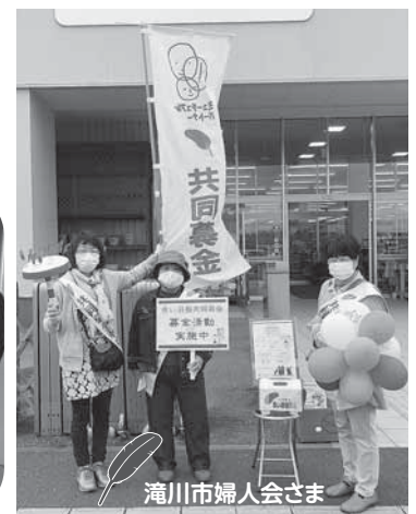
滝川市婦人会さま