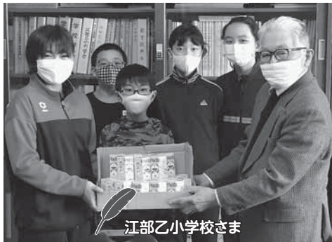
江部乙小学校さま