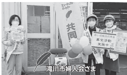
滝川市婦人会さま