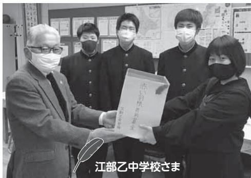
江部乙中学校さま