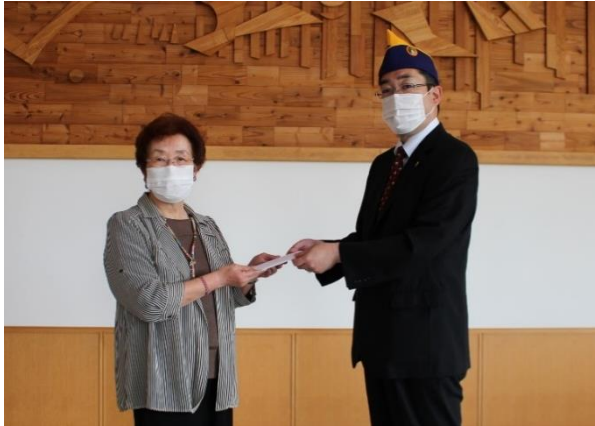
更別ライオンズクラブ 神成会長より (令和2年6月17日)