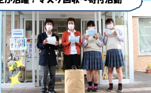
令和2年7月15日…コムニの里さらべつへ