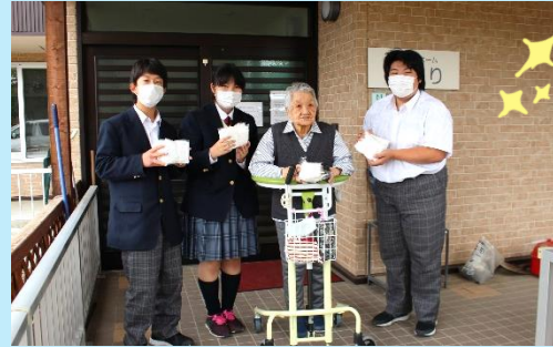
令和2年7月17日…グループホーム元気の里さらべつへ