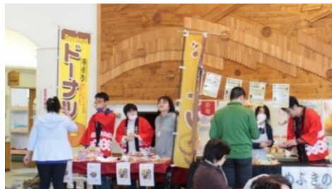
クローバーモア [協賛団体・ドーナツ販売]

また、私達の日々の活動も含め、以前のような催しが再開できるように、皆様と一緒にできるところから行っていき、前に進んで行きましょう。