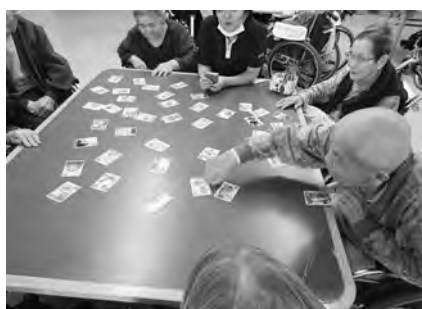
午後はみんなでかるた取り。 「はいっ!」素早く手ができました。