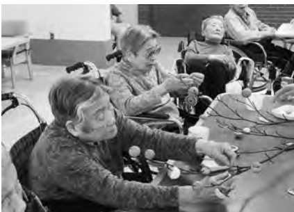
繭玉を水木の枝に付け、お正月の準備を手伝いました。