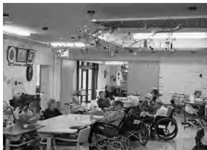
ホールの天井には無病息災を願う繭玉飾りが付けられました。