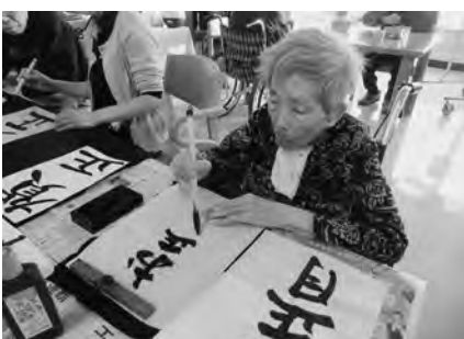
書初めて気持ちも新たに! うまく書いていますね。