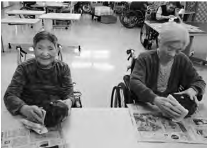
苑で収穫したカボチャです。 ぴっかぴかになりました。