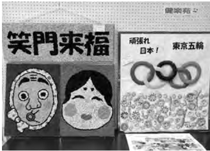
社協だよりNo.101で紹介した制作途中の張り絵が見事に完成しました！

要支援、要介護認定された方々が、毎日デイサービス「健楽苑」に通って来ています。そこで多くの利用者さん、職員と関わることで孤立感を防ぎ、体操をして心身機能を保ち、レクリエーションや作品作りなどで楽しみが見つかる。デイサービスは色々な可能性があるところですよ！