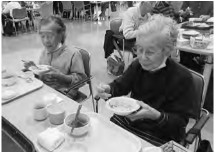
今日はホットプレートチャーハンわかめのスープが良く合います！