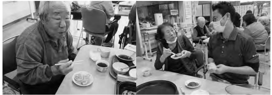
目の前のホットプレートには熱々の芋団子が。甘いしょうゆダレを掛けて美味しくいただきました