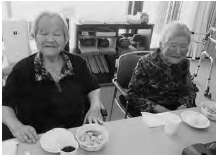
お正月。鍋を囲んでワイワイと！思わず笑顔。お箸がすすみます。