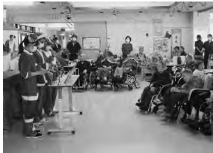
職員のハンドベルでクリスマス会が始まりました。