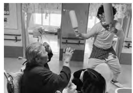
職員が扮する鬼に向かって 「鬼は外〜」ちょっと真剣です。