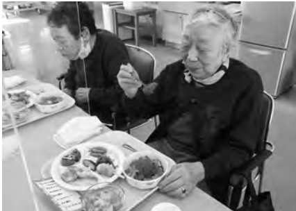
クリスマスランチに舌鼓！今日は豪華な昼食です。