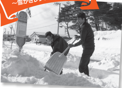
バス停の周りを雪かきをしている様子