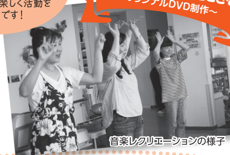
音楽レクリエーションの様子