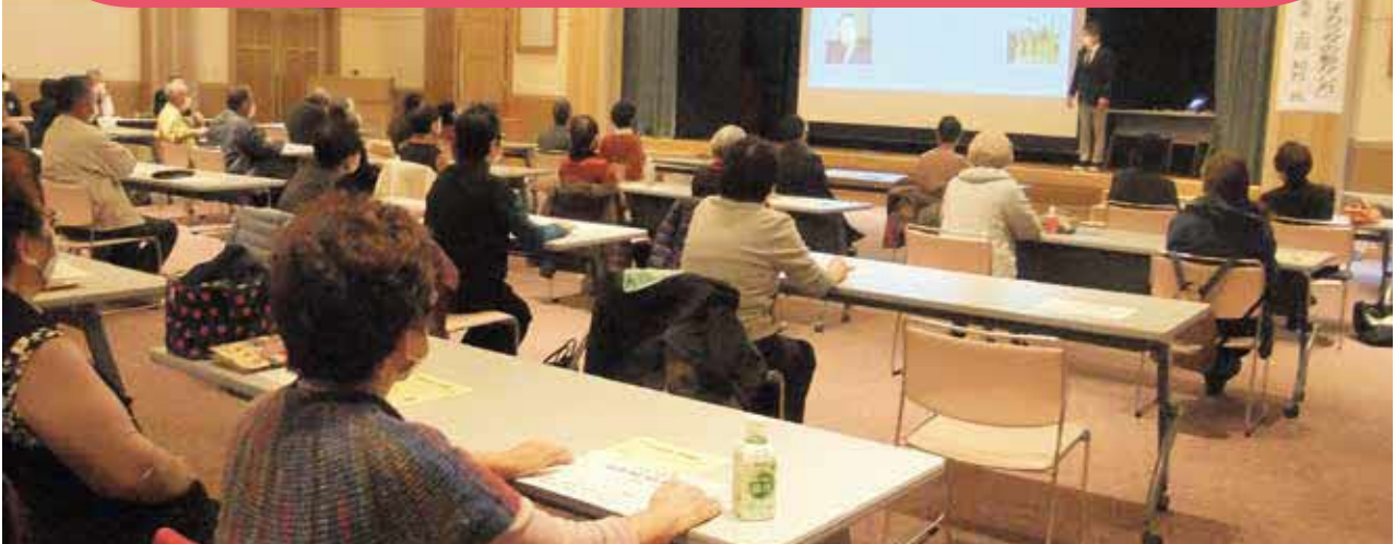
令和2年度「ふれあい広場」より

ひとは、いかなる世(家庭、社会等)でも、一人では生きていけない。そのために「助け合い」が必要である。助け合いには「助ける人」と「助けられる人」で成り立ち、「自惚(うめぼれ)」も「卑屈(ひくつ)」もない人間関係であり、「お互いさま」が原点である。