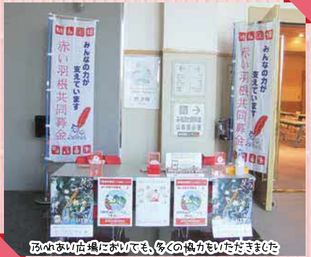
いろいろな店舗においても、多くの協力をいただきました