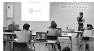
↑各種福祉団体の活動などに共同募金の一部が活用されています。