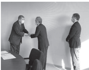
北海道信用金庫ひまわり財団 様