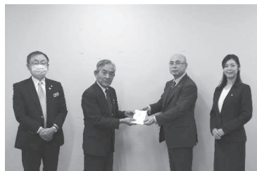
中島測量設計株式会社 様