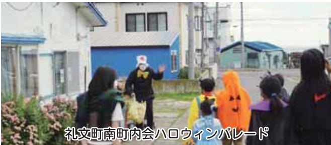
礼文町南町内会ハロウィンパレード

小地域福祉活動3町内に助成 子育て支援事業所クリスマス訪問（3カ所） 入学祝い品贈呈事業の実施：町内小学校 福祉団体への助成：各種団体7団体に助成 地域サロン開設（6月～3月）