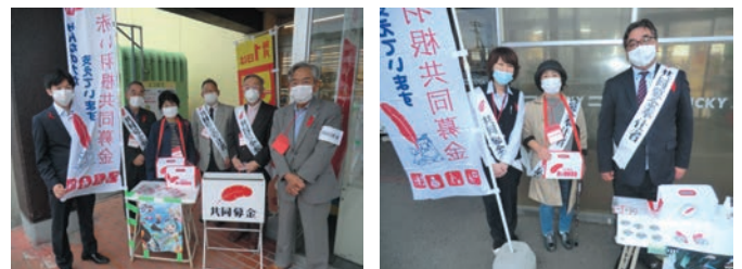
昨年の街頭募金の様子