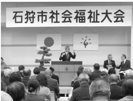
石狩市社会福祉大会 一昨年の社会福祉大会の様子 280名の皆さまにご参加いただきました。

規模や会場など感染拡大予防を踏まえた開催方法について、種々検討を重ねて参りましたが、主催者、参加者ともに不安なく開催できる実施方法に至ることができず、このような判断となりました。ご理解いただきますようお願い申し上げます。