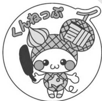
訓子府町ご当地キャラクター 「めろねっぷ」