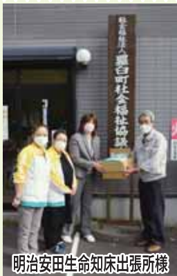
明治安田生命知床出張所様