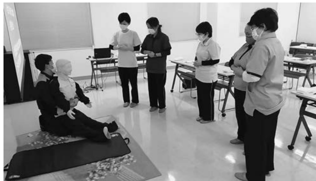
消防職員による救急対応講習会(早来)の様子

安平町社協では、本所（早来）、追分支所にそれぞれ訪問介護事業所を併設し、介護福祉士などの介護専門資格を有するスタッフが、高齢者や障がい者のご自宅に訪問し、介護サービスを提供しています。「不自由なことがあっても、住み慣れた我が家でその人らしく安心して生活していただけるよう支援する」ことを運営方針として、毎月学習会を開いて、サービスの向上に努めています。