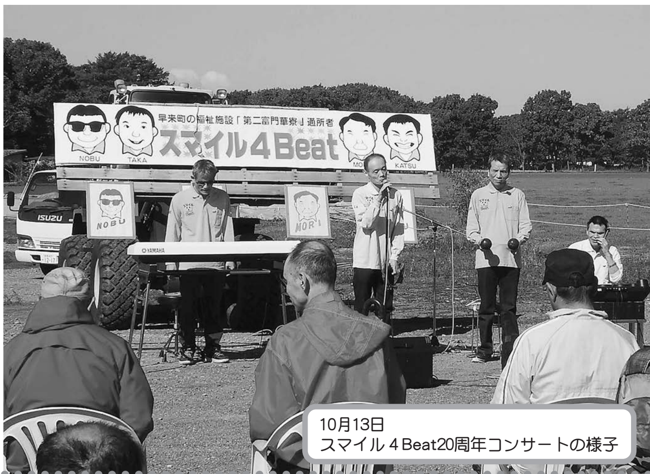
10月13日 スマイル4Beat20周年コンサートの様子