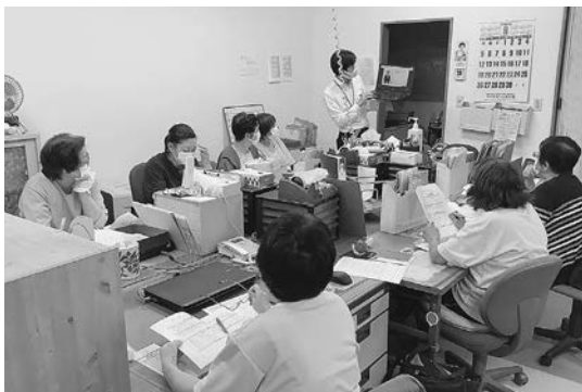
定例ミーティングでの社内研修会(追分)の様子