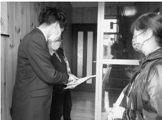
訪問調査の様子 (対象者は70歳以上の独居世帯と 75歳以上の夫婦世帯で合計35世帯)

地域で見守りが必要な方の把握や、地域の助け合い活動の促進を目的に訪問調査を実施致しました。事前に配布させていただいたアンケート用紙を用い、困りごとや利用したいサービス、災害時の対策などについてお話を伺いました。