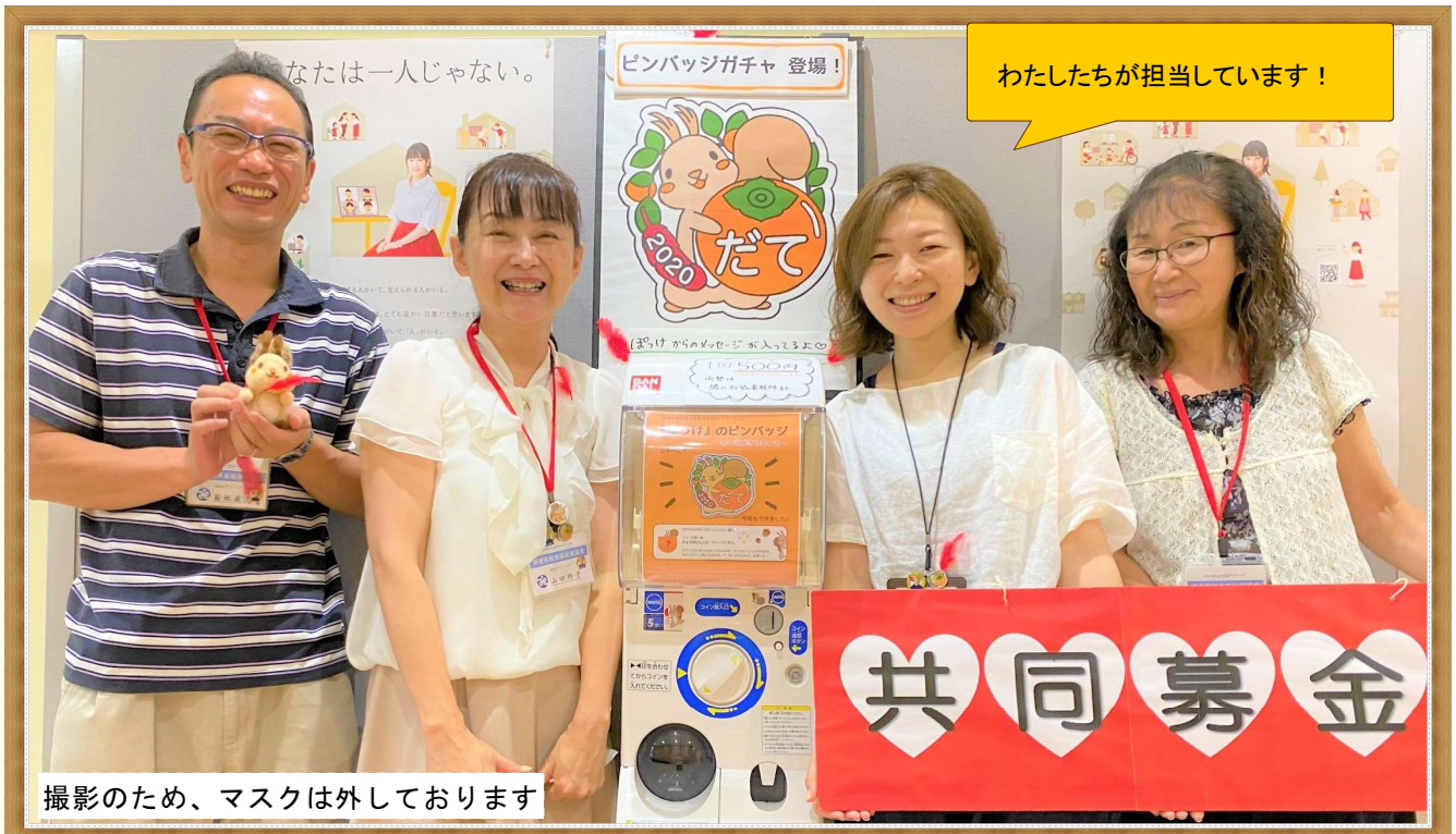
撮影のため、マスクは外しております