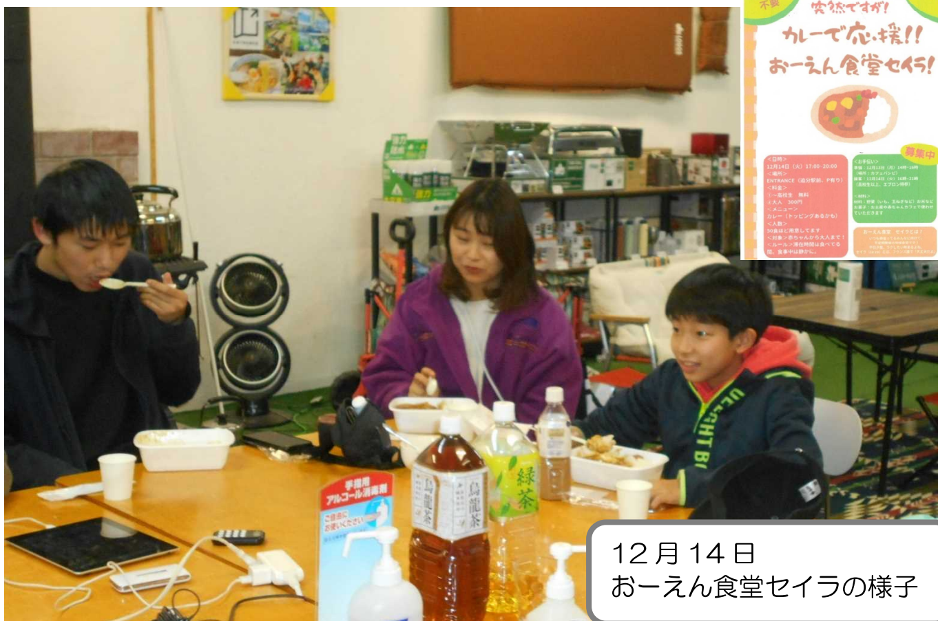
12月14日 おーえん食堂セイラの様子