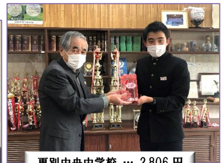
更別中央中学校 … 2,806 円