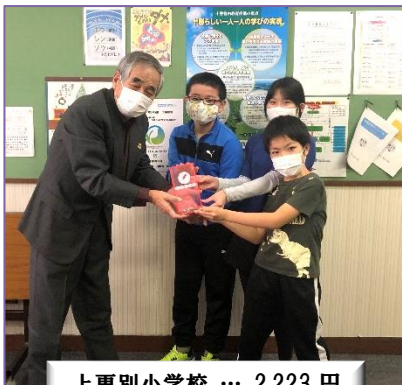
上更別小学校 … 2,223 円