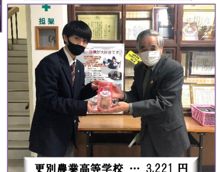
更別農業高等学校 … 3,221 円