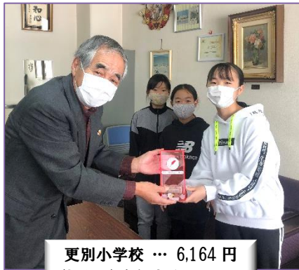
更別小学校 … 6,164 円 (加えて) 昨年度分 2,239 円