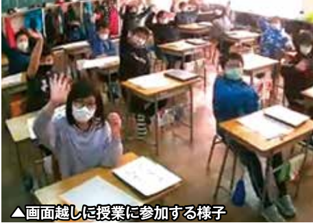
▲画面越しに授業に参加する様子

今後ICTを活用した活動支援や、ボランティア活動にかかわるパソコンやスマートフォンをサポート等を引き続き行います。お困りの際は登別市ボランティアセンター(0143-88012080)へご相談ください。