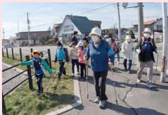
下校中の子どもたちと途中まで一緒にウォーキング！

日時：毎週金曜日 14：00から1時間程度 場所：池田町社会福祉協議会集合後、町内の規定のコースを歩きます。 参加資格：ウォーキングと一緒に健康づくりしたい方なら誰でも可。 ★ノルディックウォーキング用ポールの貸し出しも有。 ポールなしでの参加も大歓迎です。 参加申込は池田町社協579-2222（三浦）まで！