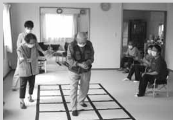
くもん脳トレ教室は令和4年度より定員を拡充して実施しています。男性の参加者もいらっやいます!▶

令和3年度の健康教室等の通いの場の実績は女性の参加者のほか、男性の参加が多い所もあります。身体を動かすのが好きな方はふまねっとやダーツ、パソコンやスマホの操作に挑戦してみたい方はオンラインサロンがおすすめです。ぜひ参加をお待ちしています。