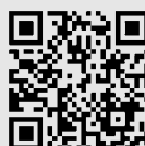
2回目動画視聴コード

※それぞれ約1時間の動画となりますので、通信料にご注意ください。(Wi-Fi環境での視聴をお勧めします)