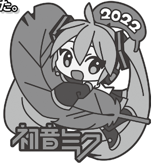
Art by 木下きのこ © CFM

北広島市共同募金会（社協内）と各地区奉仕団分団（ピンバッジのみ）で取扱いしていますので、多くの方のご協力をお待ちしています。※数量限定となっております