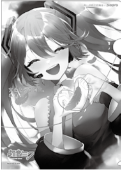
Art by nio © CFM