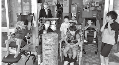
北海道札幌養護学校共栄分校