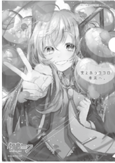
Art by あずき