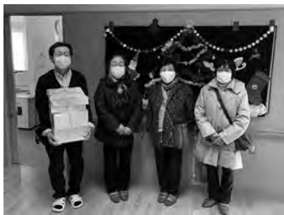
福祉施設への訪問活動 (年末にプレゼントをお届け)