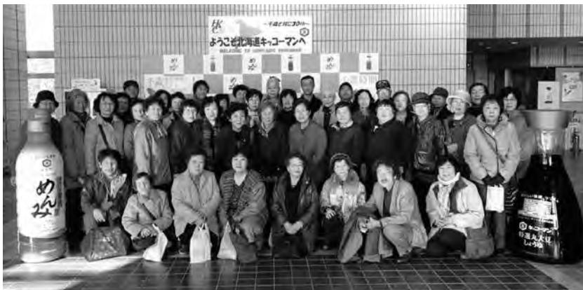
日帰り研修会での集合写真（2019年）

新規会員は随時募集しておりますので、ご興味のある方はお気軽にお問い合わせください。