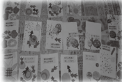
暑中見舞いの葉書が出来上がりました。全部手作りで。