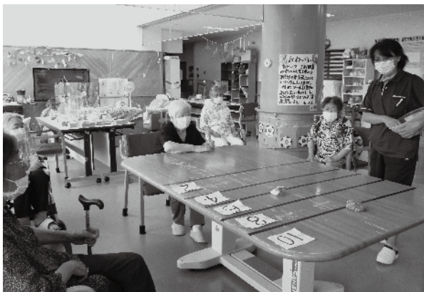
アクティビティで楽しむ利用者