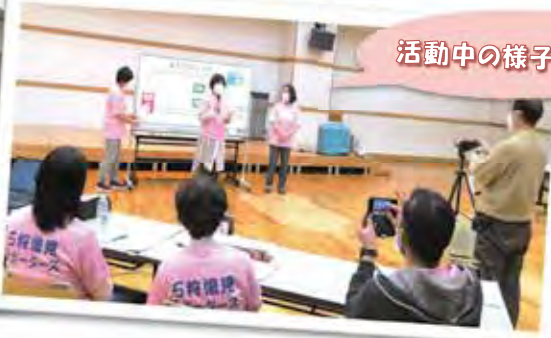
活動中の様子です！

成年後見制度とは、判断能力が十分ではない方に、法律で代理人を付ける制度です。代理人となった人が、ご本人に代わって施設契約や介護契約をしたり必要な支払いなどをすることで、ご本人の生活や財産を守る制度です。こうした成年後見制度を、「いしかり後見サポーターズ」は、高齢者クラブや町内会等で紙芝居や替え歌披露でわかりやすく説明しています。ご要望がありましたら、成年後見センターまで、是非ご連絡ください。