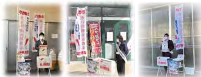
昨年の街頭募金の様子