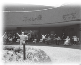
外での体操で心と体をリフレッシュ!

入居者の方々にとって自分の家と思えるよう、またお一人お一人が気楽に過ごせる日常に心がけながら、今後も職員一同支援して参ります。