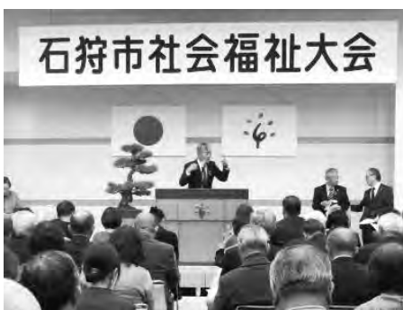
令和元年の社会福祉大会の様子 280名の皆さまにご参加いただきました。

規模や会場など感染拡大予防を踏まえた開催方法について、種々検討を重ねて参りましたが、主催者、参加者ともに不安なく開催できる実施方法に至ることができず、このような判断となりました。ご理解いただけますようお願い申し上げます。