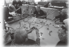
皆さんで協力して団子木を作成しています。