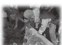
真剣にお花を植えています。

「ここに来るとホッとする」「ここに来るのが一番の楽しみ」とご利用者様に言って頂けることを励みに、今後もお利用者様が笑顔になれるデイサービスを目指して、職員一同、頑張つて参ります。