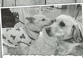
先代ドルチェの時から お友達の「みずほ」★ 普段わんぱくだけど お兄さんらしくしてましたよ!