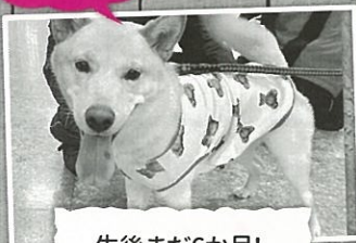
生後まだ6か月! 元気いっぱい 「クック」ちゃん♡