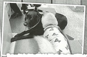
なんだかぎこちない…?笑 何でも興味津々の若い クックちゃんに押され気味の 淑女ビビアンなのでした~