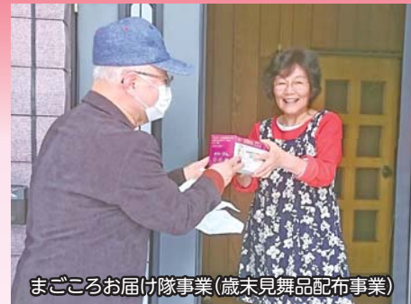
まごころお届け隊事業(歳末見舞品配布事業)