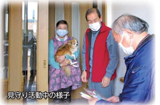
見守り活動中の様子

東部東光地区社協(東光10～25条5・6丁目)で行っている安心見守り事業では、主に高齢者世帯を対象とし、郵便物や電気の点灯、車の様子等に変わりがないかを気にかけて、見守りを実施しています。最近、高齢者のみならず、障がいなど、何らかの生きづらさを抱え、地域とのつながりが弱くなっている世帯も増えており、対面の見守りに加え、さりげない見守りも行っています。