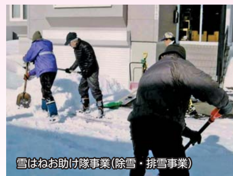
雪はねお助け隊事業(除雪・排雪事業)