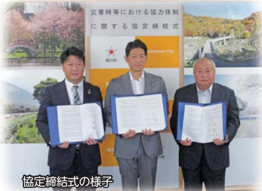
協定締結式の様子

旭川市社会福祉協議会と旭川市は、昨年度に「災害ボランティアセンター設置・運営に関する協定」を締結しており、令和4年7月には東旭川町米原地区における水害被災世帯への支援を行うなど、市と連携して被災世帯への支援に取り組んでいます。