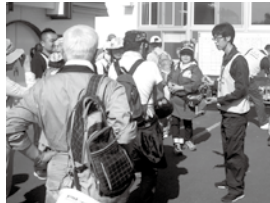
災害ボランティアに説明している様子

今回は、災害ボランティアが被災者支援を行う際に求められる心構え・配慮について紹介します。