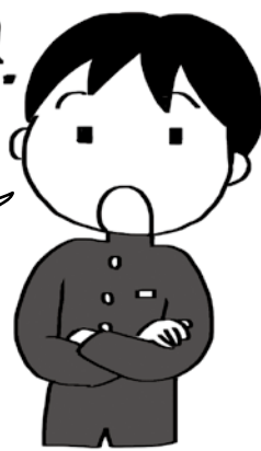
千歳のとある中学生

ニュースで、高齢者が増えて介護の心配をしている人がいると聞いたよ。 地域ではどんな問題があるか、知りたいな！