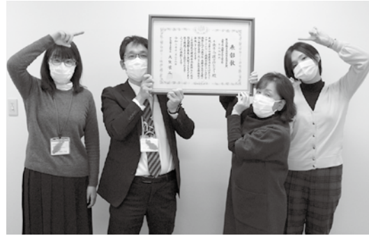
厚生労働省老健局長優良賞を受賞！

ちとせdeコレクションが「第10回健康寿命を延ばそうアワード！」で受賞しました！