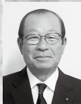
会長 武文 会 力 示