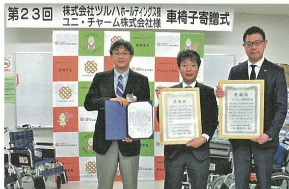
昨年度の贈呈式の様子

11月15日「第24回車椅子寄贈式」を札幌市内で開催予定、今年も札幌市社会福祉協議会に20台の車椅子を寄贈致します。この寄贈は、ユニ・チャームとツルハグループ様が地域貢献の一環として、2000年から毎年行っている活動で、今回が24年目となり、これまでに寄贈された台数は今回を合わせて300台となります。これまでに寄贈した車椅子は、札幌市内の施設などで貸出や移送サービスに活用されています。