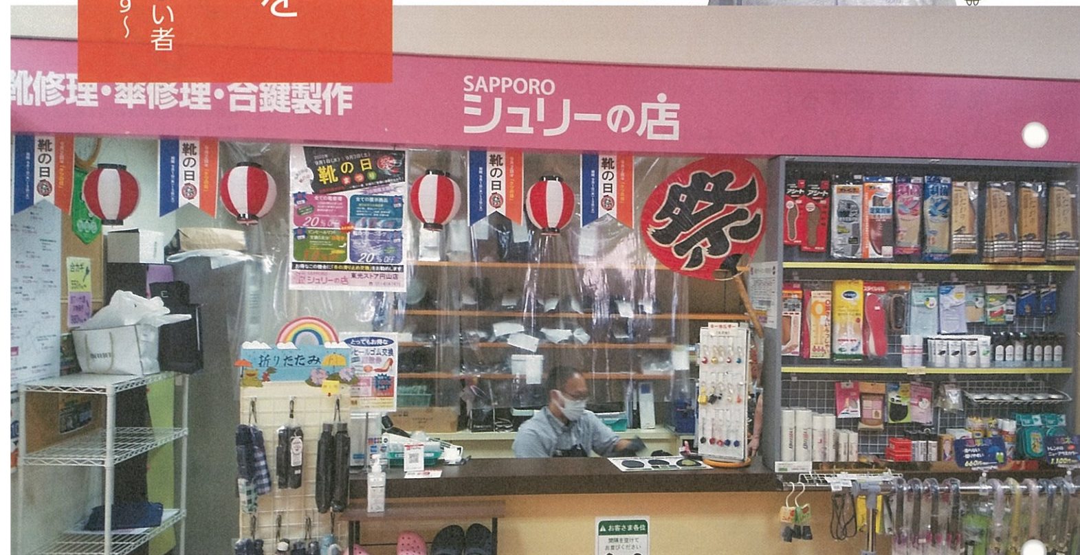
東光ストア円山店