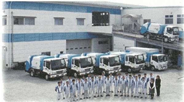
鹿児島にあるリサイクル施設

※水平リサイクルとは、使用済みの製品を原料として同じ種類の製品をもう一度つくるリサイクルのことです