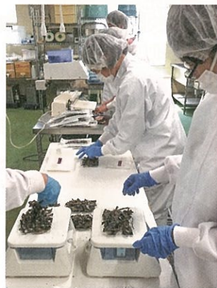
企業からの受注作業

慢性的な福祉系職の担い手不足と長続きしない現実、中でも工賃向上を目標に作業受注の安定化を目指してきました。障がいのある方が安心して生活できる場と生産活動に参加(いわゆる社会参加)できる場所でもあります。