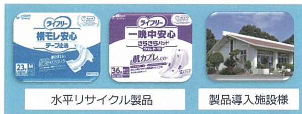
水平リサイクル製品

紙おむつの使用量が、年々増えています。高齢化が進んで、紙おむつを必要とする人が増えているからです。使い終わった大量の紙おむつは、日本ではほとんどがごみとして燃やされています。ユニ・チャームは、紙おむつメーカーの責任として、これをごみにしないで、もう一度紙おむつとして再利用できないかと考えました。使い終わった紙おむつは、水分を含み、汚れもついています。ユニ・チャームは何年も試行錯誤を重ね、ついに独自のリサイクルモデルを実現しました。現在は鹿児島県の施設からですが、水平リサイクル商品を実際にお客様にお届けしております。