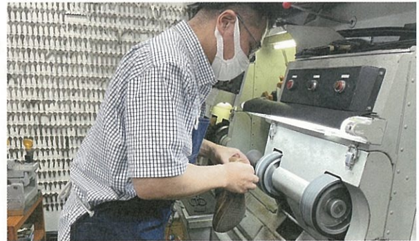
靴の修理作業風景

靴底の張り替えは、研磨した靴底に業務用接着剤を塗ってから滑り止め素材を張り、靴底面の面取りをして完成します。