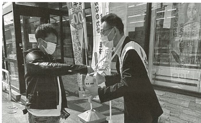
(令和4年10月 街頭募金活動 セコマ初山別店前)