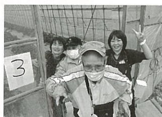
(いちご狩り 苫前町)