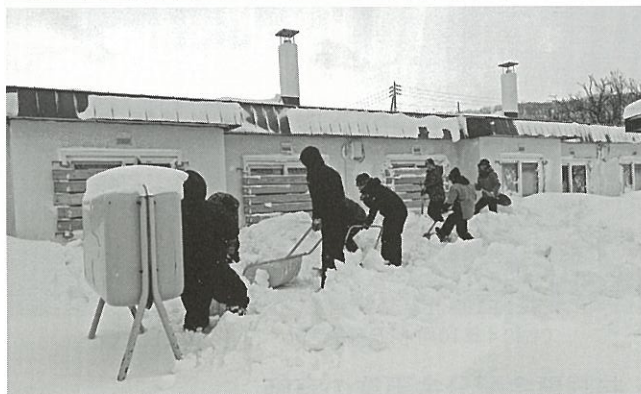
(初山別中学校 除雪ボランティア 令和5年1月)