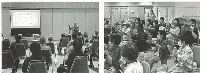
(講演「認知症の理解と予防について」 令和5年7月)