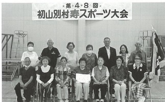
(第48回 寿スポーツ大会 令和5年7月)