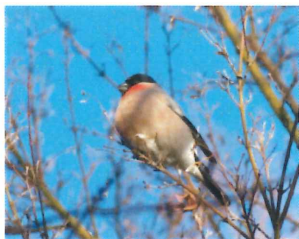
ウソ 学名 Pyrrhula pyrrhula 生息 北海道(留鳥) 特徴 フィーフィーと口笛のような声で鳴き、サクラの花芽が大好き 分類 スズメ目アトリ科