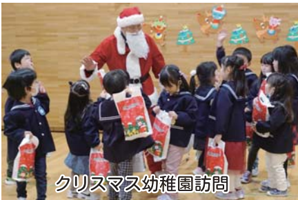
クリスマス幼稚園訪問

障がい者調理体験、障がい児者ふれあい交流会の実施 福祉団体事業の援助（共同募金委員会・老人クラブ連合会・身体障がい者福祉協会・遺族会・手をつなぐ親の会）