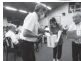
チャリティーゴルフ大会