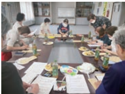
敬老の日イベントの準備の様子

末広町内会にて、閉じこもりがちな高齢者のためのサロンを企画したり、花壇整備を行ったりと精力的に取り組まれています。会員は15名おり、民生児童委員や福祉委員などボランティアや福祉に関心のある方が活動しています。