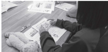
「オレンジカード配布」

ました。グループごとの話し合いでは「困っている認知症の方への対応」について意見を出し合い、寸劇では認知症を演じる方に対して実際に対応することで、より具体的なイメージを持つてもらいました。