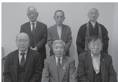
各地区民児協会長

また、長年にわたり地域福祉の推進にご尽力いただいた退任委員は33名で、最長で24年間務められた方もおり、その功績に深く感謝申し上げます。