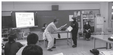
「寸劇で認知症高齢者をイメージ」

今回の講座には12名の生徒が参加しました。はじめに認知症の基礎知識や接し方について説明を受け、その後、寸劇やグループワークを通じて具体的な対応方法を考え