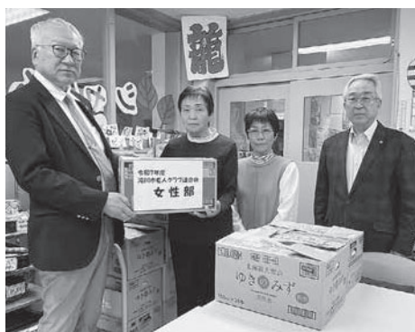
市老連女性部様より贈呈の様子