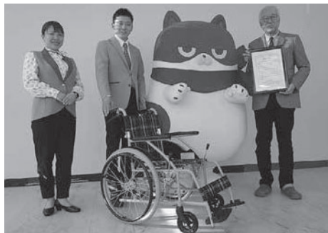
(株)マルハン滝川店様より贈呈の様子