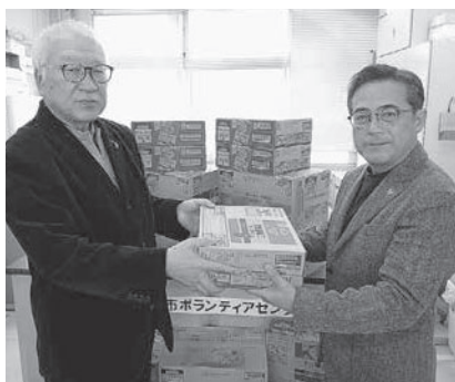
北海道コカ・コーラボトリング(株)様より贈呈の様子