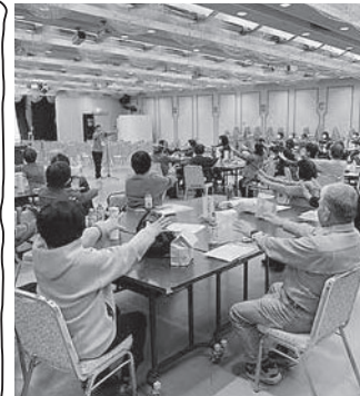
交流会レクリエーションの様子

市内でボランティア活動を行っている個人・団体の皆さま約50名が集いました。講演・交流会とも身体を動かし、声を出しておおいに盛り上がりました。