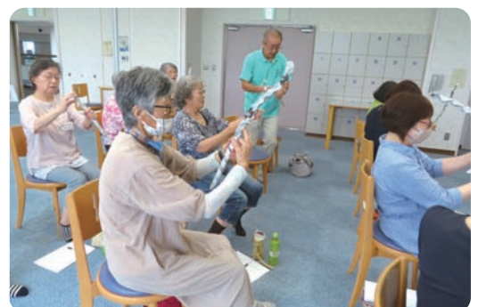
ボランティア養成講座