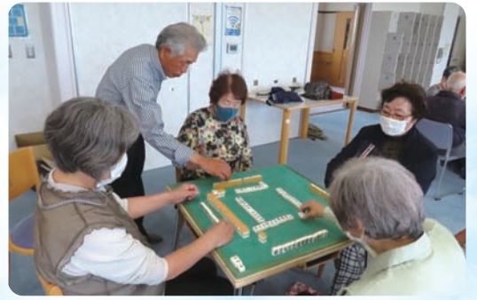
高齢者いきいき健康マージャン