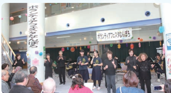
ボランティアフェスタなんぼろ