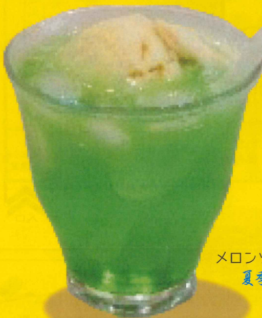
メロンソーダフロート 夏季限定